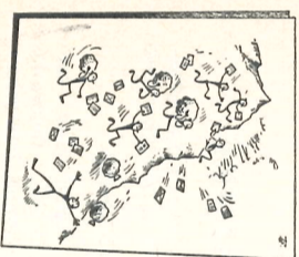
Zoals u weet schreef de redactie direct na de fabrieksvakantie een prijsvraag uit voor leuke vakantie-verhalen.

Wanneer Zijne Majesteit afleiding zoekt, dan gebeurt het wel eens, dat hij met echte soldaten gaat spelen. Het bataljon parachutisten wordt dan opgecommandeerd en de soldaten moeten één voor één springen. De koning zit aan de voet van de toren onder een baldakijn te kijken met naast zich een zak met dollarbiljetten. Elke soldaat, die behouden op de grond terecht komt, moet langs de toren lopen, salueren en ontvangt dan één dollar voor de sprong. Deze slecht betaalde soldaten zijn dan dolgelukkig met deze milde koninklijke gift.